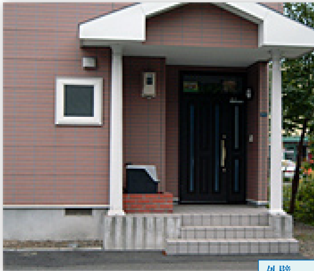
外壁 施工前外観イメージ