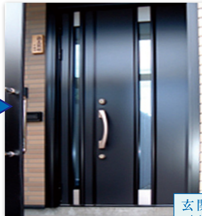
玄関ドア 交換工事後イメージ