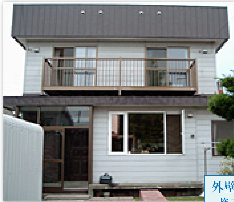
外壁 施工前外観イメージ