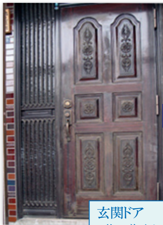
玄関ドア 施工前イメージ