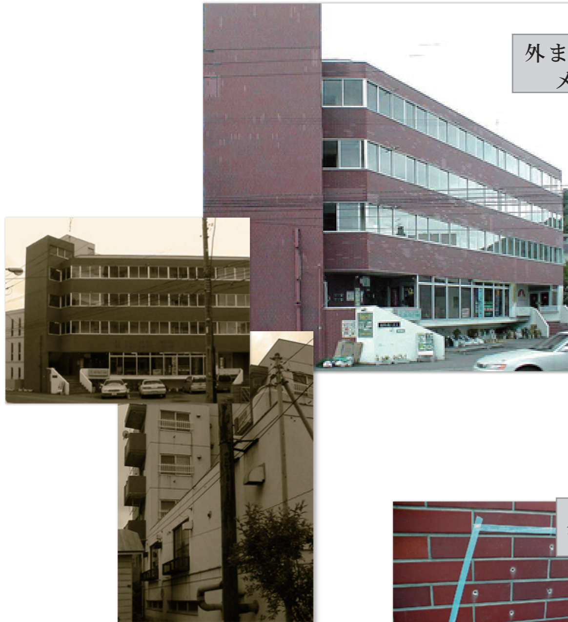
外まわりの メンテナンス